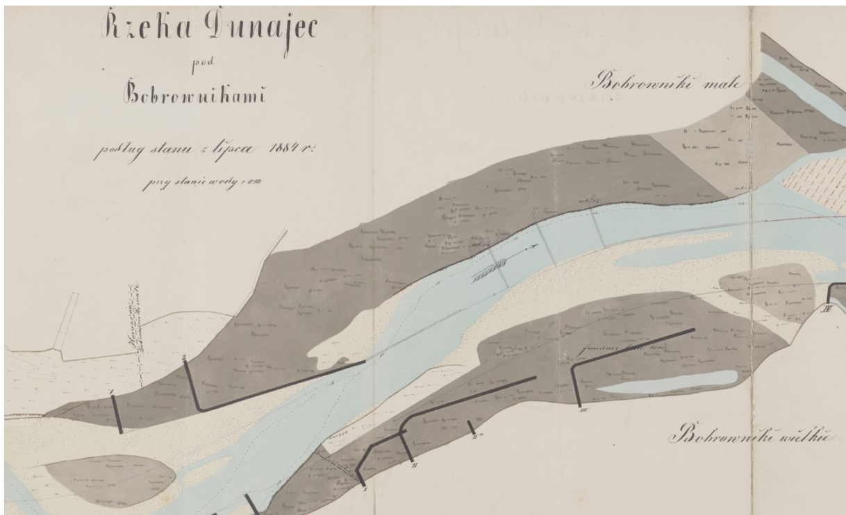
Część mapy z granicą Bobrownik Małych i Komorowem.