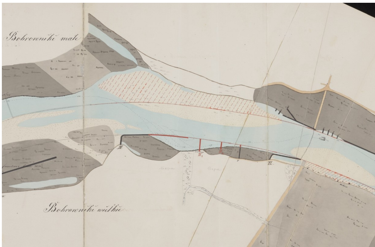
Na mapie widoczna przeprawa w Bobrownikach Małych. Była nią łódź przymocowana do łańcucha przeciągniętego przez Dunajec. Widoczne plany regulacji rzeki.