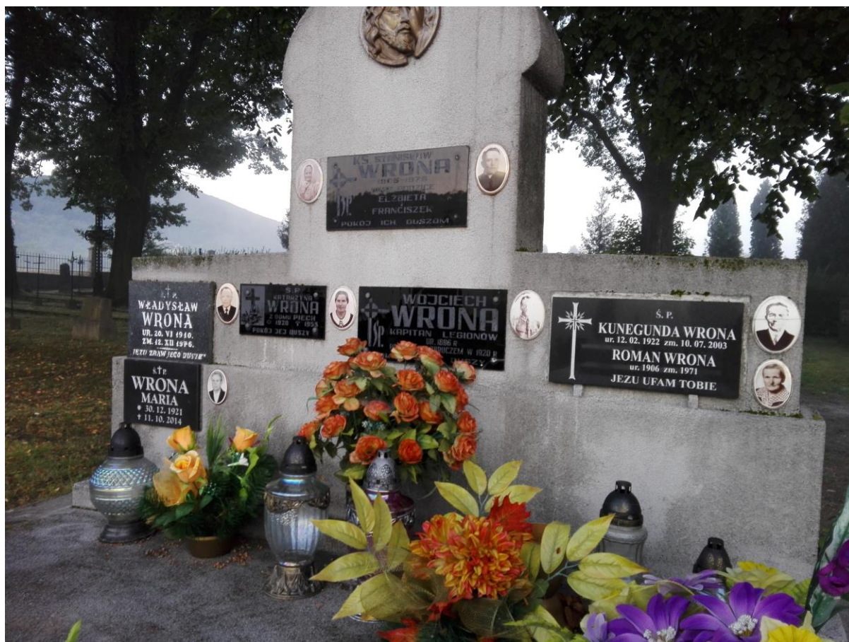
Nagrobek rodziny Wronów na cmentarzu w Żegocinie